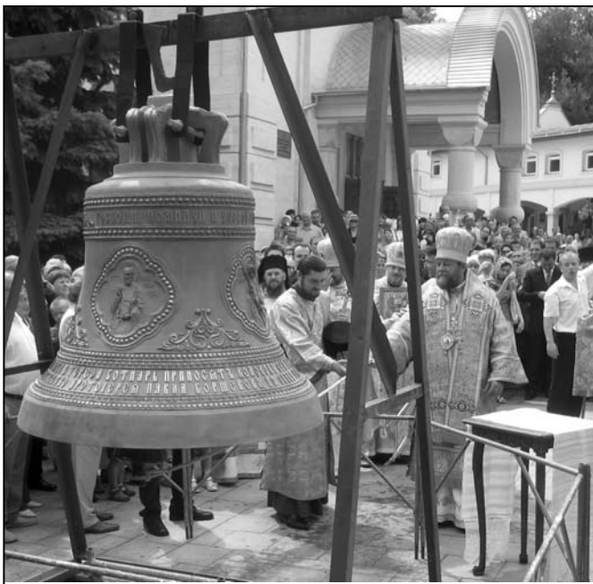
Mitropolitul Vladimir sfințește clopotul de 1,7 tone la biserica Sf. Dumitru din mun. Chișinău în ziua pomenirii Sf. Apostoli Petru și Pavel

În această duminică Înalț Prea Sfințitul Mitropolit Vladimir alături de un sobor de preoți a săvârșit Sfânta și Dumnezeiasca Liturghie la Catedrala „Nașterea