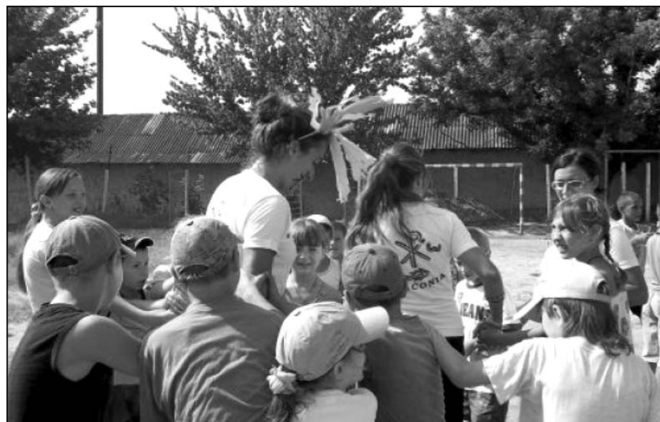
Tabăra solidarității la Coșcalia

În perioada 1-14 august, Misiunea Socială „Diaconia” va desfășura pentru al patrulea an consecutiv proiectul „Taberele Solidarității”. Acesta este realizat în parteneriat cu organizația Caritas Ambrosiana (Italia). În fiecare vară, un grup mixt de voluntari din Italia și Republica Moldova organizează tabere de vară cu regim de zi în 4 localități.