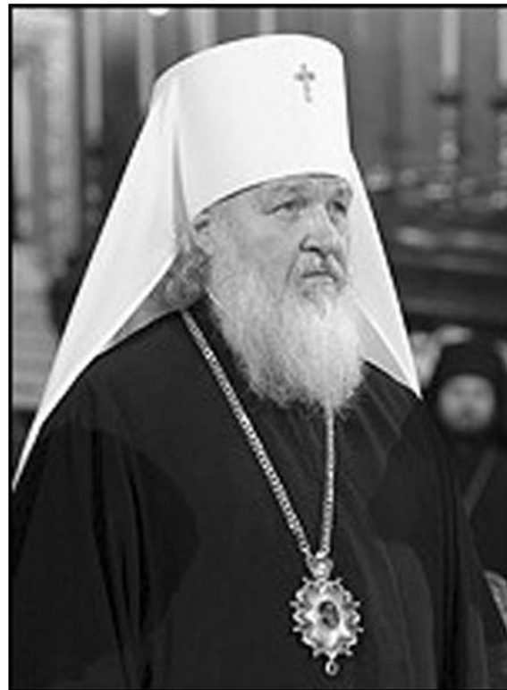
10.09.2010, Moscova - La întâlnirea cu președintele Irlandei, Mary McAlleese,