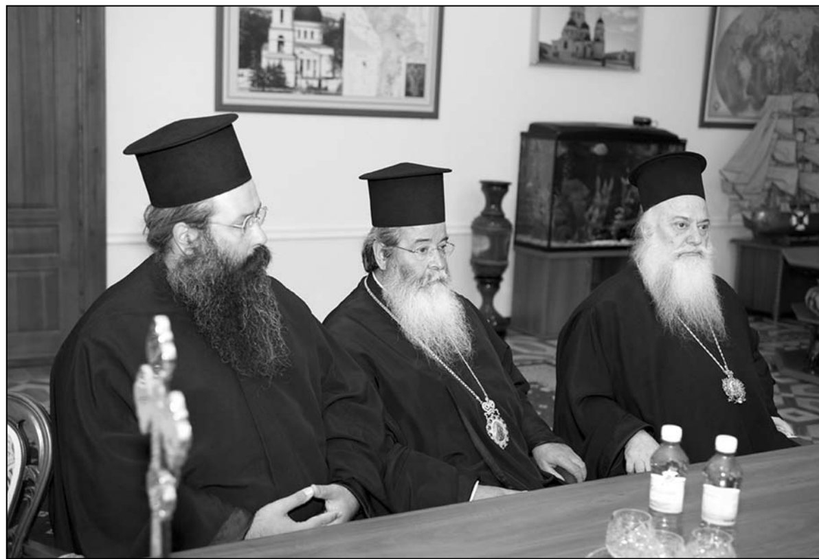
Ierarhii greci în vizită la Palatul Mitropolitan din Chișinău