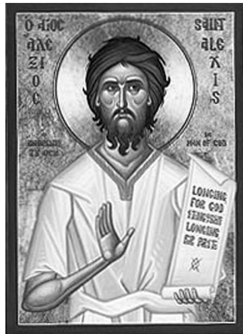
apropiau de ele.

împlini această dorință, deoarece corabia cu care călătorea, împinsă fiind de vânt, a fost îndrumată într-altă parte. Ajungând deci la Roma, a venit la casa părinților lui. Aici, nemaifiind cunoscut de nimeni, își petrecea viața înaintea porții casei sale, luat în derădere și batjocorit de înșiși servitorii lui, pătîmind atât de mult, cât poate pătîmi un om străin lipsit de orice îndrăzneală din partea unor oameni petrecăreți și gălăgioși. Când a simțit că i se apropie fericitul sfârșit, a cerut o bucată de hârtie și a scris pe ea cine este și unde s-a născut. Și a păstrat această hârtie la el, până când împăratul Onoriu, după o descoperire dumnezeiască, venind la el, l-a găsit dându-și duhul. Și rugându-se de el și luând de la el scrisoarea și citind-o în auzul tuturor, au cunoscut cu toții cele cu privire la el. Deci, toți fiind cuprinși de spaimă, au luat și au îngropat cu cinste și cu mare cuviință sfințele lui rămășițe în biserica sfântului apostol Petru, moaștele lui răspândind după aceea miruri cu bun miros și vindecări tuturor celor ce se