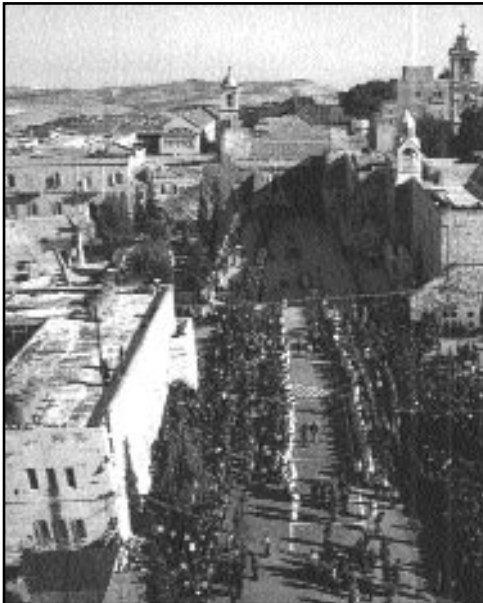
Betleem, în ajunul Crăciunului

S Sosirea Întâistătorilor Bisericii Ortodoxe împreună cu însoțitorii acestora, a șefilor de state, a prim-miniștrilor, miniștrilor și a celorlalți invitați.