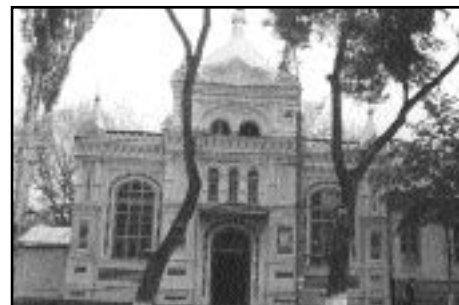
Biserica "Sf. Ierarh Nicolae" din or. Chișinău.

Duminică, 19 decembrie, însoțit de un numeros sobor de preoți, a oficiat Sf. Liturghie la biserica "Sf. Ierarh Nicolae" din or. Chișinău, de curând revenită sub jurisdicția canonică a Mitropoliei Chișinăului și întregii Moldove.