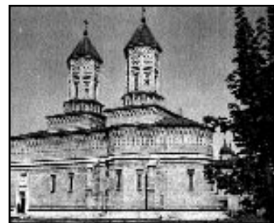
Biserica „Treierari” din Iași, în curtea căreia a trăit un timp poetul

secol din momentul trecerii în nemurire a Lucașăruului poeziei noastre. Noianul uitării a acoperit atâtea evenimente și figuri istorice trecătoare! N-au încetat, însă, a-l troieni cu drag și recunoștință aducerile aminte, deoarece în tot ce a plâsmuit și a lăsat posterității sunt prezente și vor dăinui peste vreme talentul și dăruirea, pasiunea și sinceritatea, dorința pentru prosperitatea semenilor, actualul și eternul. Anul 2000 este declarat anul EMINESCU. Nu există, probabil, poet sau scriitor român care să nu se fi inspirat din izvorul neseecat al operei eminesciene: