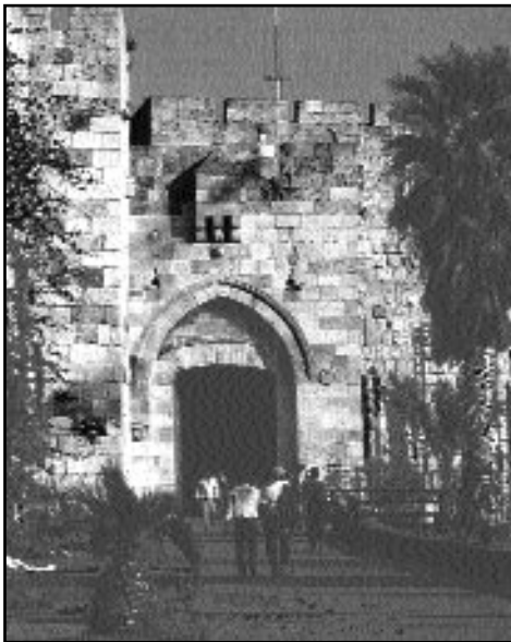
Ierusalim, porțile Damascului

Simpozion panortodox la Ierusalim, cu tema „Mărturia Bisericii în al treilea mileniu după Hristos” și Liturghie arhierescă cu participarea arhierilor reprezentanți ai Bisericilor Ortodoxe.