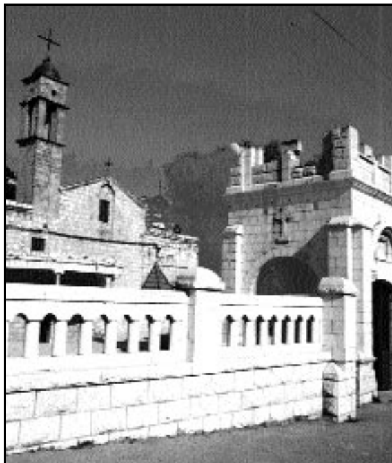
Nazaret, Biserica „Sf. Gavriil”

Acesta este marele moment de însemnătate universală, ce împarte