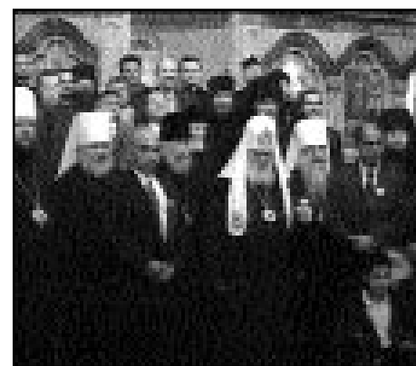
4 ianuarie. Palestina. ÎPS Vladimir în componența delegației Bisericii Ortodoxe.

Sfântă cu ocazia împlinirii a 2000 de ani de la Nașterea Mântuitorului.