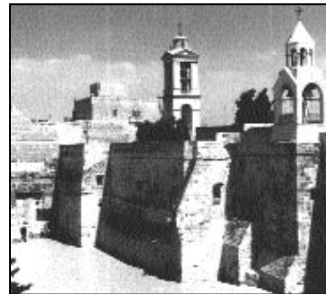
Betleem, Basilica Nașterii Mântuitorului

Sfânta Liturghie cu participarea reprezentanților Bisericii Ortodoxe Autocefale și a Patriarhului Ierusalimului la Betleem.