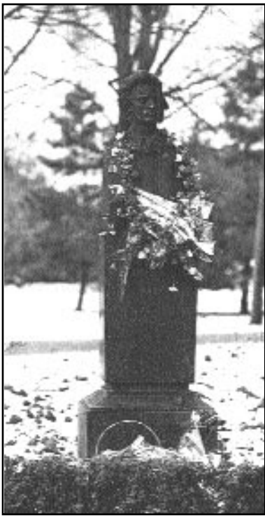
Bustul poetului din Alea clasicilor

„Este inimaginabilă o istorie a literaturii universale fără prezența unor creatori străluciți cum a fost poetul Mihai Eminescu” (Vasko Popa)