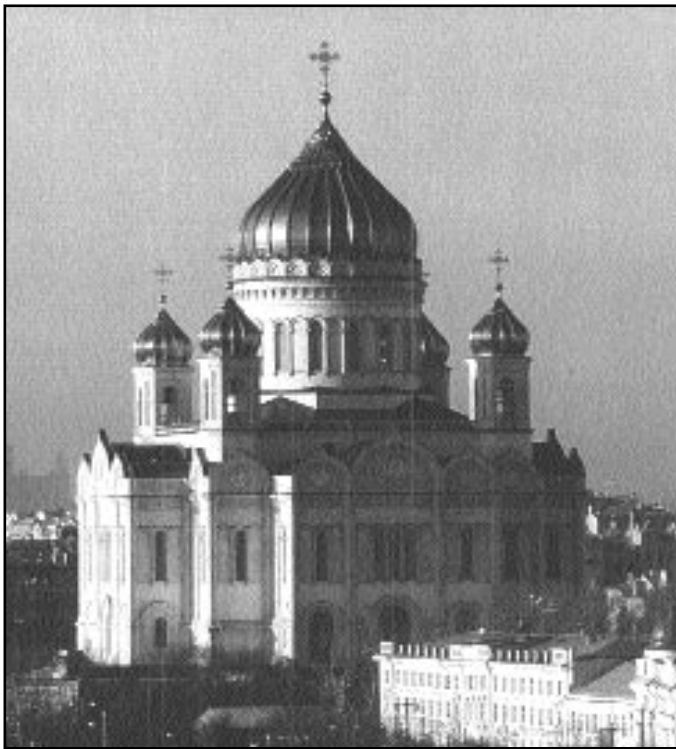
Moscova. Catedrala “Hristos Mântuitorul”

Unii preoți, în mod neautorizat, au introdus printre întrebările puse la spovedanie și cea cu referire la acceptarea codului de impozitare, iar refuzul la înregistrarea fiscală fiind pus drept condiție pentru permiterea Sfintei Împărtășanii. Vă re-