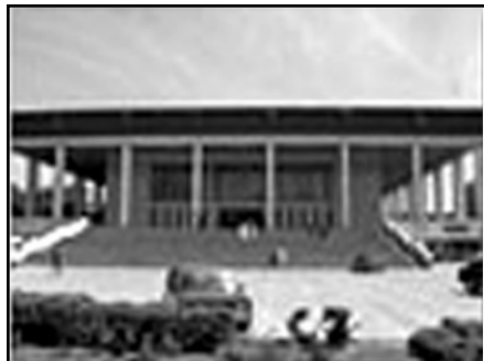
Chișinău, Teatru de Operă