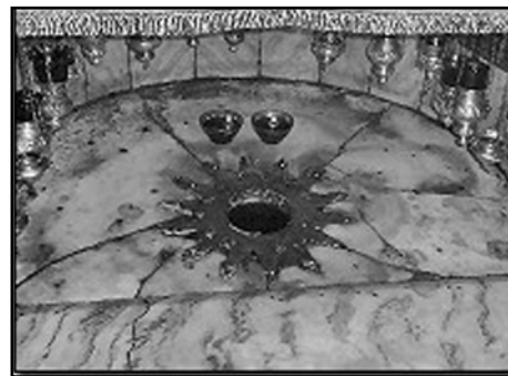
Betleem, Locul nașterii Mântuitorului

Data la care a fost sărbătorită Nașterea Mântuitorului a fost diferită în lumea creștină. În Apus, până prin secolul al III-lea, Crăciunul se prăznuia pe data de 25 decembrie, când avusese loc recensământul împăratului Cezar August (25 decembrie 754 ad Urbe condita - de la întemeierea Romei), la care face referire evanghelistul Luca. În schimb, în Răsărit, până în a doua jumătate a secolului al IV-lea, Nașterea Domnului era serbată la 6 ianuarie, adică în aceeași zi cu Botezul Domnului, și se numea Arătarea Domnului sau Epifania. Cele două sărbători s-au separat în jurul anului 375. Armenii serbează însă și astăzi Crăciunul în aceeași