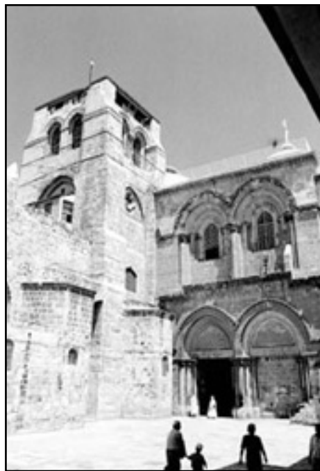
Betleem, Bazilica Nașterii Mântuitorului

În fiecare an, la 25 decembrie / 7 ianuarie, întreaga creștinătate prăznuiește Nașterea Domnului Iisus Hristos, Împăratul și Dumnezeu nostru, Crăciunul, cum spunem noi romanii. Prin întruparea Fiului veșnic al lui Dumnezeu și Nașterea Sa ca Om, acum mai bine de 2.000 de ani, se descoperă în modul cel mai profund iubirea și bunătatea nesfârșită a lui Dumnezeu față de lume (Ioan 3, 16). Nașterea Domnului aduce în inima fiecăruia bucuria răscumpărării noastre, pe care Sfântul Ioan Gura de Aur o mărturisea astfel: “Toate puterile îngerești împreună cinstesc aceasta sfântă prăznuire, contemplând Dumnezeu pe pământ și omul în ceruri. Cel mai presus de toate sălășluiește acum jos pe pământ pentru a noastră mântuire, pentru ca cel aflat jos să fie ridicat mai presus de toate după harul îndumnezeitor”.