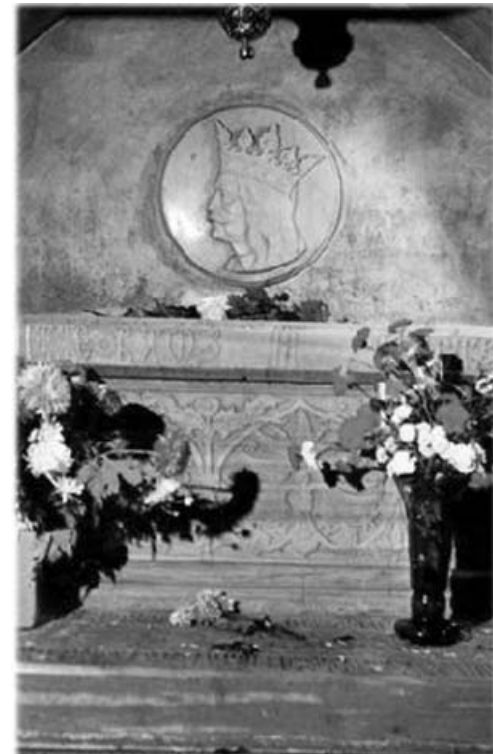
Mormântul lui Ștefan cel Mare