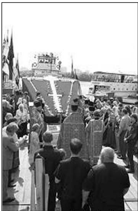
locul poligonului „Butovo” lângă Moscova, într-un loc unde au fost executați mii de oameni de poliția secretă sovietică.

Crucea, înaltă de 12, 5 metri, cea mai înaltă din Rusia, este ridicată pe