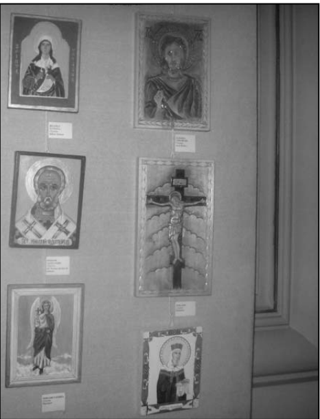
Fragment din expoziția lucrărilor copiilor de la centru social „Sf. Dumitru”

Pentru concurs ei au trimis la redacție încă din toamnă un șir de lucrări de pictură și sculptură în lemn, care au impresionat juriul. Astfel unii au devenit laureații ai celei de-a XV-a ediții a concursului.