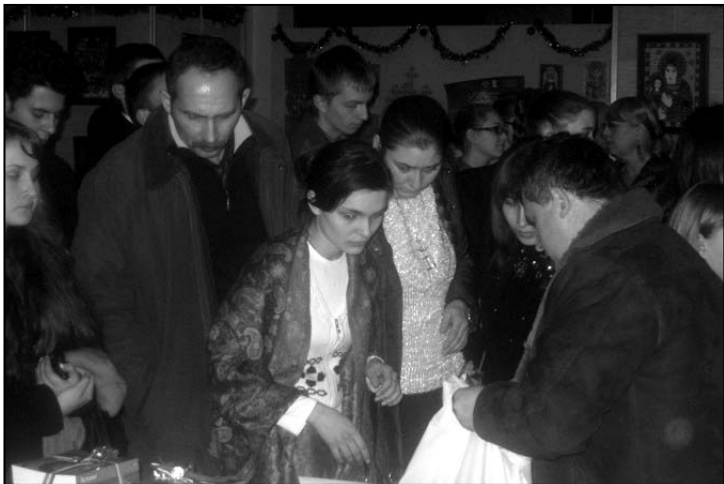
Secvență de la ceremonia de premiere