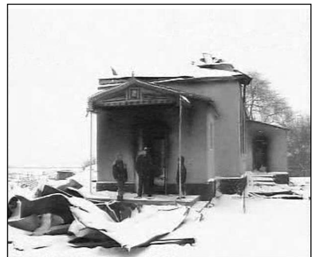
Așa arată în prezent biserica din Mileștii Noi, după dezastruosul incendiu din 4 ianuarie 2008

Biserica din Mileștii Noi a fost construită acum 14 ani și împodobită din jertfa creștinilor din satele învecinate.