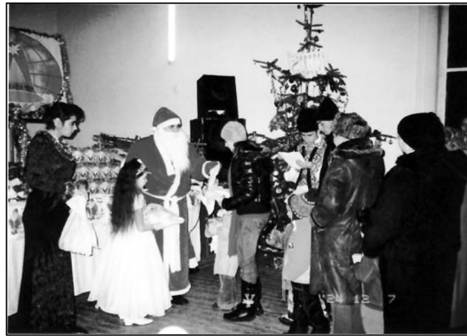
Moș Crăciun a venit la copiii din Lozova, Strășeni

Din an în an odată cu urătorii vestim la fereastra sufletelor evlavioșilor noștri moldoveni și ai bunilor gospodari, mesajul bucuriei fără de margini pe care o simțim mereu în perioada sărbătorilor de iarnă.