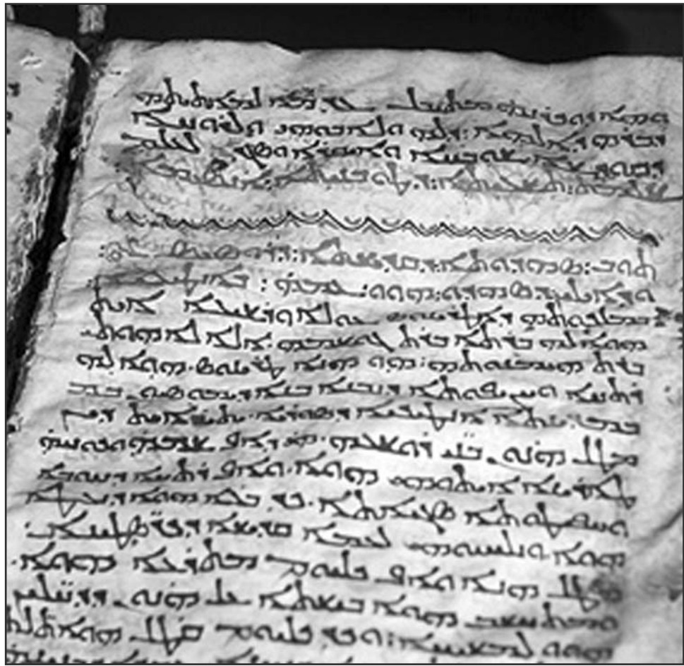
Un fragment din "Codex Sinaiticus" păstrat în Muzeul Britanic din Londra

Primul fragment din cel mai vechi exemplar al Bibliei este disponibil on-line de joi, 24 iulie a.c.