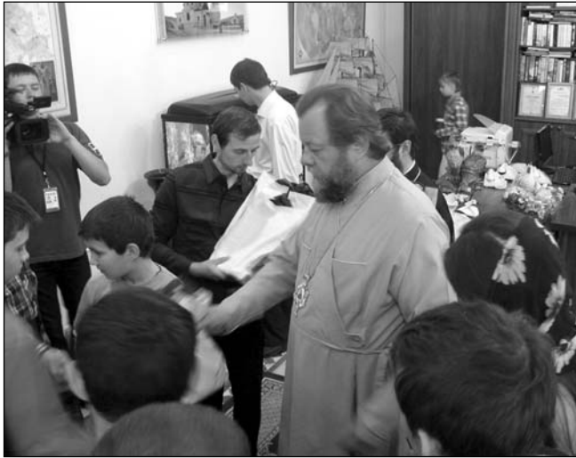
15 mai, întâlnirea ÎPS Vladimir cu copiii de la centrul de rehabilitare sportivă „Aoris” din Chișinău în cadrul campania „Durerea se vede și se simte de aproape”.

10 mai ÎPS Mitropolit Vladimir a sfințit o nouă aeronavă a companiei "Air Moldova"