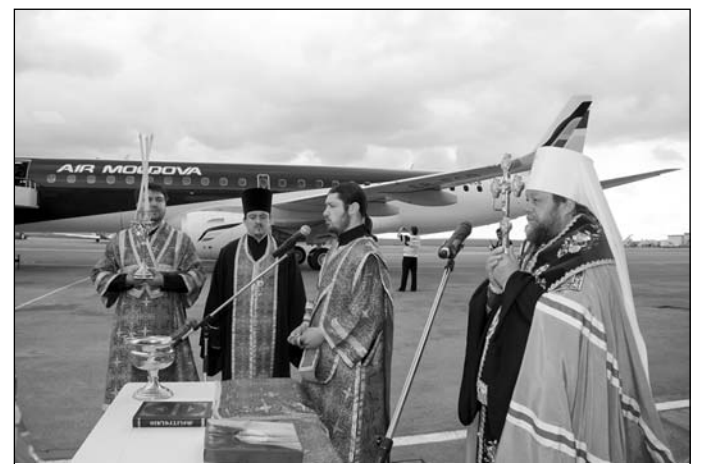
Moment de la evenimentul sfințirii aeronavei

La eveniment a fost prezent și președintele interimar al Republicii Moldova, domnul Mihai Ghimpu, care împreună cu șeful „Air Moldova” a tăiat panglica la intrarea în aeronavă și a felicitat