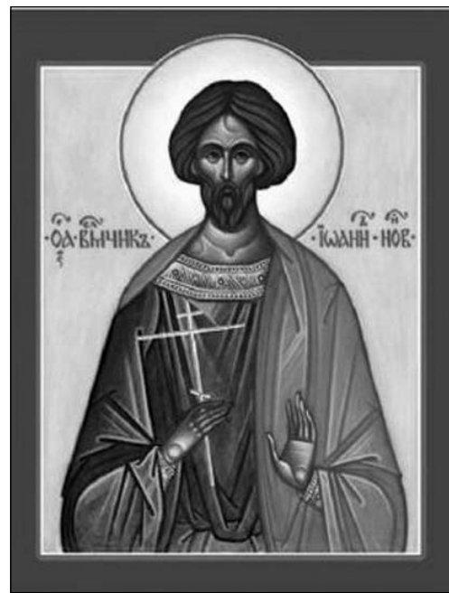
Sf. mucenic Ioan cel Nou de la Suceava

Cuviosul Nicodim cel Sfințit de la Tismana († 26 decembrie 1406), care se serbează la 26 decembrie (se păstrează doar degetul cel mare de la mâna dreaptă, la mănăstirea Tismana);