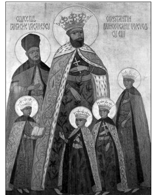
Sf. mucenici Brâncoveni

Binecredinciosul voievod Ștefan cel Mare și Sfânt (2 iul), †1504. Acestuia, în 2004, Sfântul Sinod i-a schimbat și titulatura și gradul de cinstire în Sfântul voievod Ștefan cel Mare;