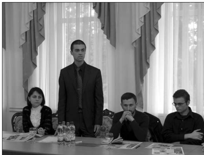
moment din cadrul conferinței

Joi, 22 aprilie, în incinta blocului principal al Universității de Stat a avut loc o nouă reîntrunire a Alianței Ortodoxe din Republica Moldova.