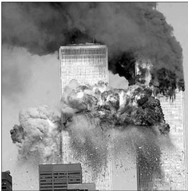
Turnurile Gemene din New York, distruse de teroriști islamiști la 11 septembrie 2001

Pacea pe care o oferă Hristos nu este una teritorială, ci interioară. Ea nu se obține prin supunerea întregii lumi cum încearcă să o facă conducerea musulmană prin expansiune teritorială, ci prin experimentarea odihnitorei făgăduințe divine de iertare, protecție și mântuire. Este o pace interioară, care ne face capabili să triam într-o lume tulburată, fără a permite ca inimile noastre să fie cuprinse de teamă și ură. Aceasta este pacea de care fiecare ființă umană are nevoie. Aceasta este pacea care-i poate ajuta pe oameni să trăiască în pace cu Dumnezeu, cu ei înșiși și cu alții.