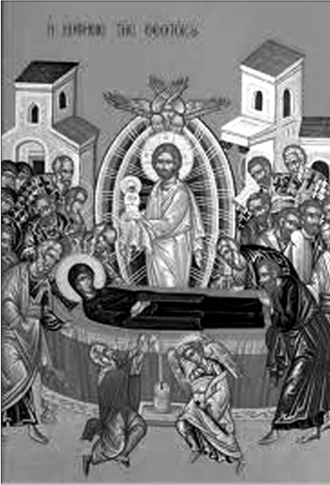
Această cântare este încadrată în slujba de priveghere, cântându-se în trei stări, fiecare respectând

Prohodul Maicii Domnului a fost alcătuit de Manuel din Corint la începutul secolului al XVI-lea, după modelul Prohodului Mântuitorului, care se cântă în Vinerea Mare. Generalizată mai ales în bisericile rusești, a pătruns și în spațiul românesc, prin traducerea făcută, în 1820, de Ion Pralea.