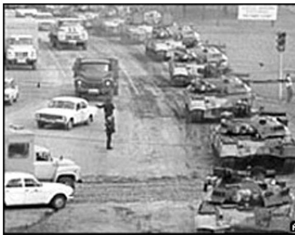
Tancurile vin spre capitală