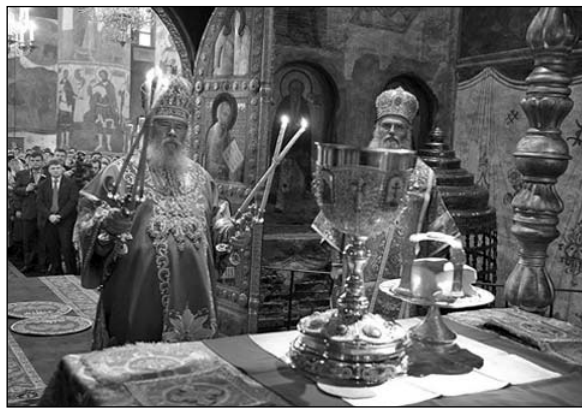
Moscova. 19.08.1991. Liturghia în catedrala Adormirea Maicii Domnului, în Kremlin

Am intrat în catedrală și am pregătit cele necesare pentru serviciul divin. Era și firesc lucrul acesta, dacă luăm în vedere că clădirea catedrale nu era transmisă Bisericii, ci funcționa ca și mai înainte în calitate de muzeu.