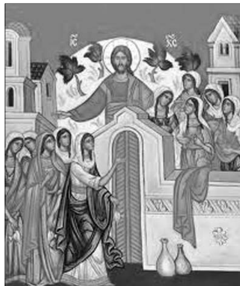
Din pildă reținem că cinci fecioare au

Marti se face pomenirea celor zece fecioare. Este o pildă care are menirea să ne ține trează datoria de a trai permanent în Hristos. Numai așa vom avea răspuns bun la judecata finală, căci prin împlinirea voii divine, Hristos ia chip în noi. Concluzia acestei pilde este că Hristos, trebuie să Se regăsească în fiecare dintre noi în orice moment.