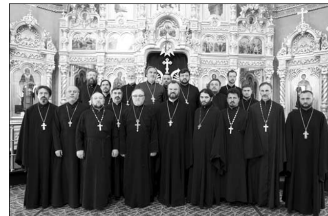
Participanții la adunarea protopopiatului sectorului II, Chișinău

preoții protopopiatului de Chișinău, sector II, după cum urmează 24 de iscălituri