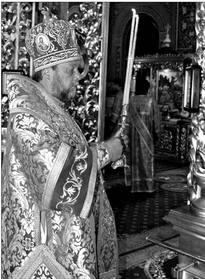
Ministerului Mediului în frunte cu Domnul Ministru

În dimineața zilei, un grup de colaboratori ai